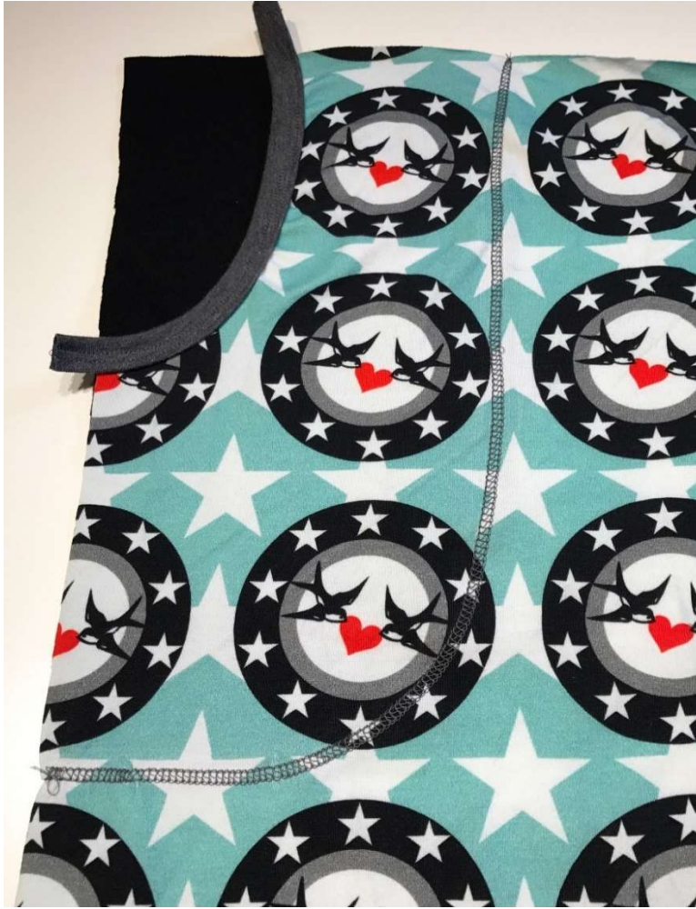
Sy fast fickan med dekorsöm.