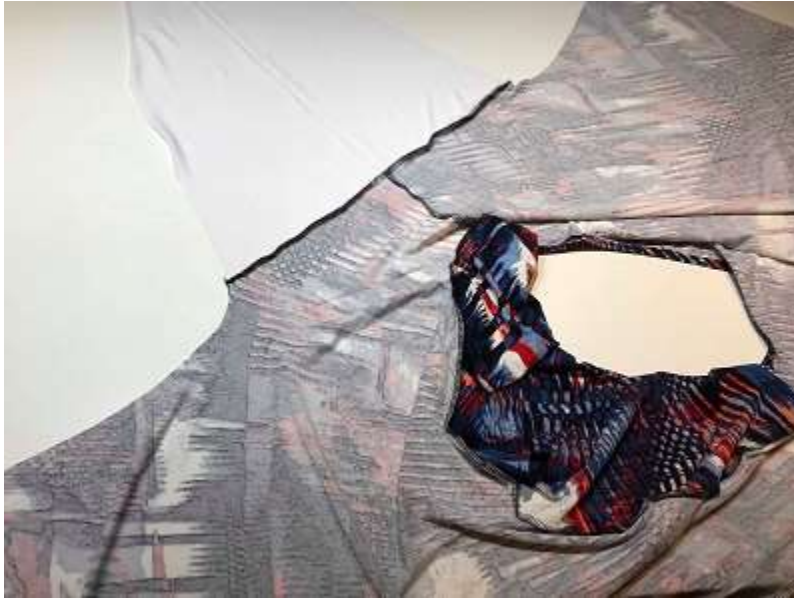
Sy fast ärmen mot ärmhålet.