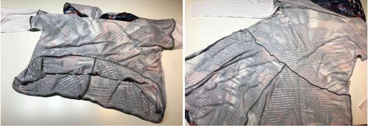
Sy ihop. (bilden visar kjol med fyra delar)