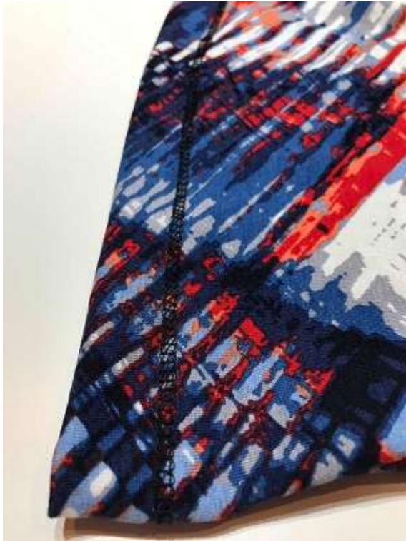
Topp, tunika eller klänning: Fålla nerfill.