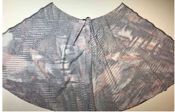
Kjol av 2 delar (mot vikt kant).

Lägg kjolarna räta mot räta och sy ihop sidsömmen.