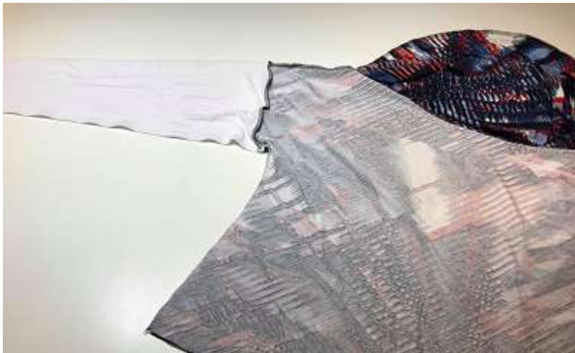
Sy ihop sidsömmarna.