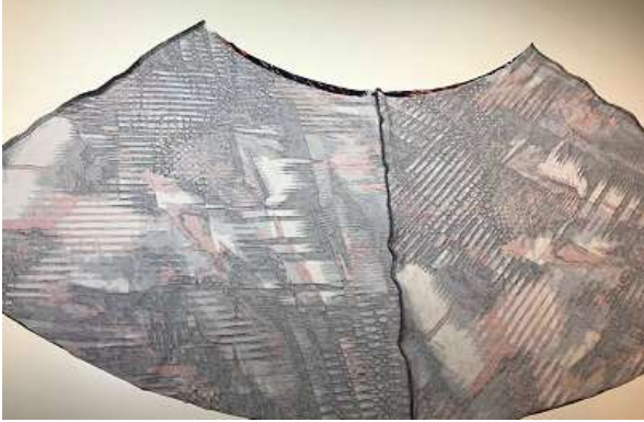
Kjol av fyra delar (ej mot vikt kant).